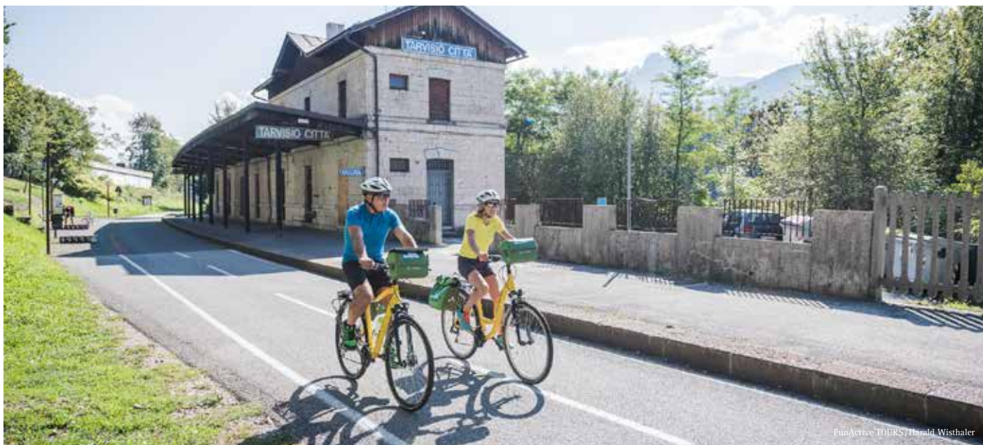
FunActive TOURS / Harald Wisthaler